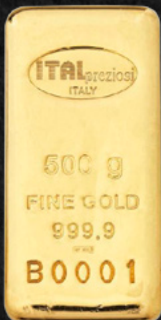
500 gr 84,0 x 40,0 mm profondità 8,50 mm