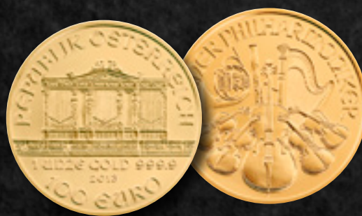
VIENNA PHILHARMONIC Purezza: 999,9/1000 Peso: 31,1000 gr Dimens. Diam. 37,00 mm Paese di Origine: Austria