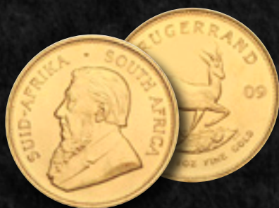
KRUGERRAND Purezza: 916,6/1000 Peso: 33,9305 gr Dimens. Diam. 32,61 mm Paese di Origine: Sudafrica