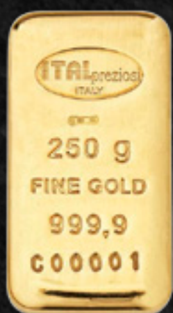
250 gr 57,0 x 30,0 mm profondità 8,50 mm