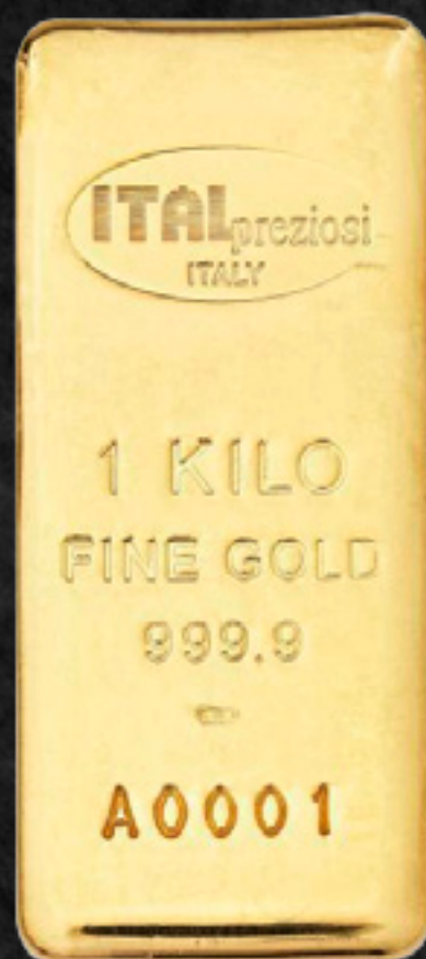
1000 gr 115,0 x 50,0 mm profondità 9,50 mm